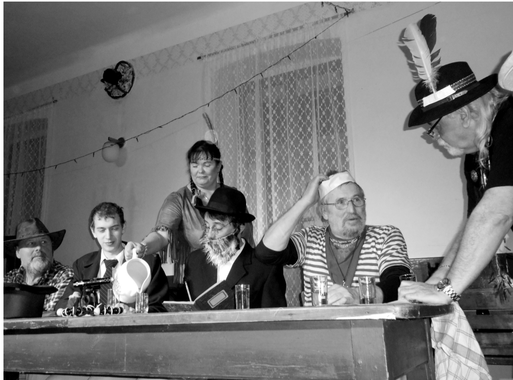
KDYBY tady bylo pivo. To je název hry, jejíž premiéru uvedli herci Divadla ze stodoly ve Skříplu v bývalém hostinci. Představení zhlédlo přibližně sto diváků.

Podle diváků vtip hry a propojení mluveného slova s písňovými výstupy připomíná princip, na němž si svoji skvělou pověst vybudoval například pražské divadlo Ypsilon a je divácky velmi vděčný, jak se potvrdilo i v tomto případě.