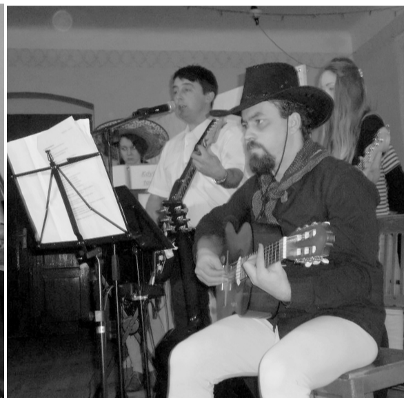
ÚČINKUJÍCÍ do jednoho odvedli výborné výkony herecké i pěvecké, dá se říci až profesionální.