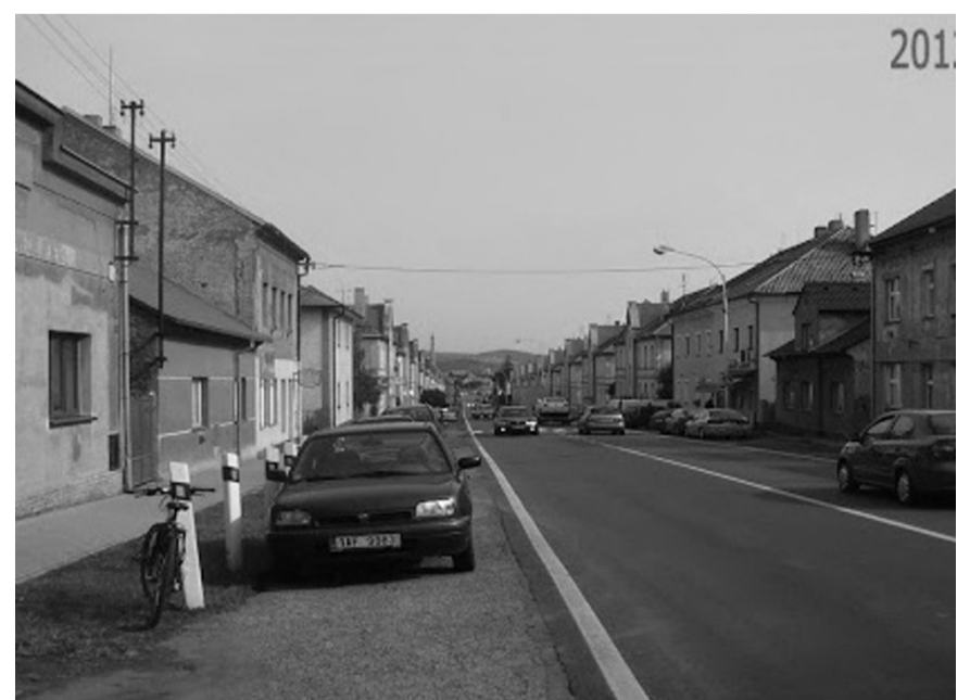
POČAPLY. Hlavní třída Králova Dvora je Levínský kopec. Kdysi hlavní tah z Prahy do Plzně a naopak. Pamětníci si ještě dnes vybavují, jak se projíždělo dělnickou kolonií. Kolonii tvořilo 20 domů, postavených v roce 1905 podle návrhu architekta A. Wertmüllera. Vlevo býval obchod s oděvy. Domy jsou v současné době zrekonstruované a silnice je nejrůznější částí Králova Dvora.