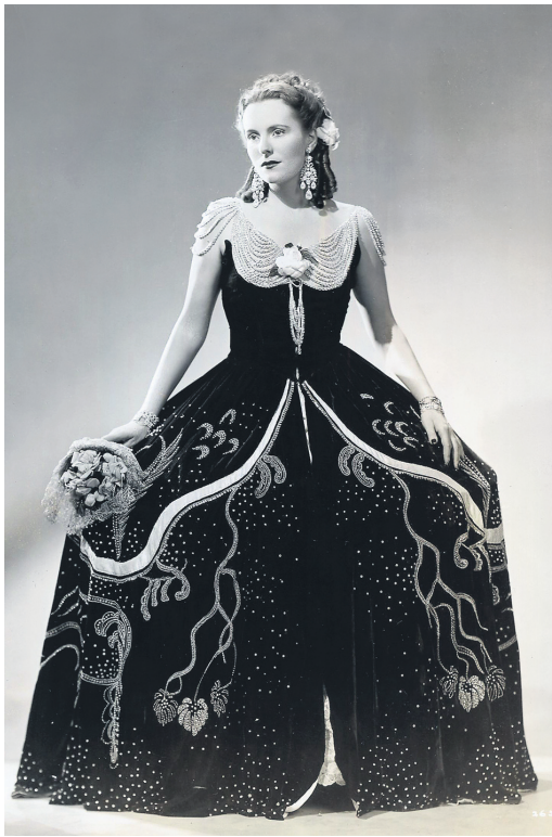
MIMORÁDNÁ ŽENA. Jarmila Novotná v civilu a v kostýmu, který sopranistka oblékala v roli Violetty v La Traviattě.